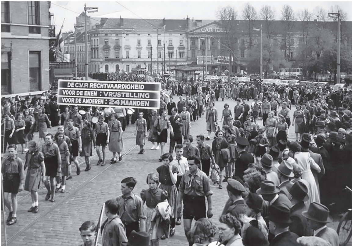
betoging tegen de 24 maanden dienstplicht te Gent op 4 mei 1951