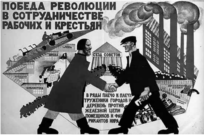
1925 "De revolutie overwint met vereende kracht van boeren en werkers"