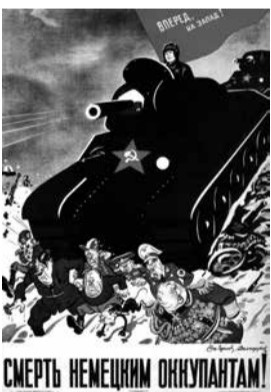
1942 "Dood aan de Duitse bezetter"