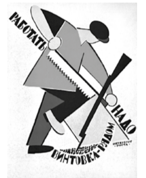
1920 “Werk zonder schrik, het geweer is bij de hand”