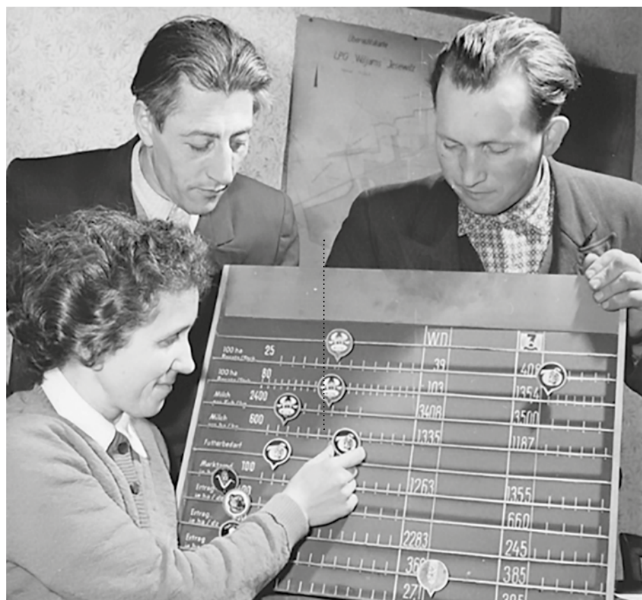
Arbeiders in Jesewitz bekijken het productieplan, 1960