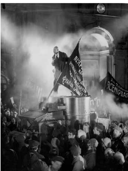
Beeld uit de film Oktober van Sergei Ejsensteyn en Grigori Alexandrov, 1928